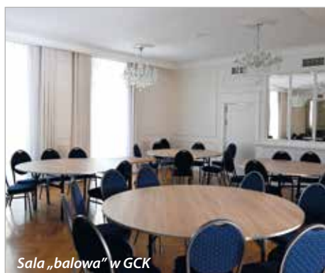
Sala „balowa” w GCK

Zachęcamy Państwa do udziału w różnego rodzaju aktywnościach. Zostało uruchomione kino, gdzie prezentujemy filmy zarówno dla dzieci, jak i dla dorosłych. Stand-up'y, które swoją treścią bawią każdego. Organizujemy koncerty muzyczne z bogatym repertuarem: od bluesa, poprzez jazz do muzyki poważnej i biesiadnej. Po-