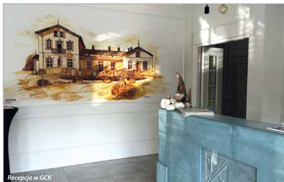
Recepcja w GCK

tańcówki i koncerty plenerowe z muzyką na żywo. Taką ofertą realizujemy nasze zadanie, aby poprzez kulturę inicjować integrację lokalnej społeczności.