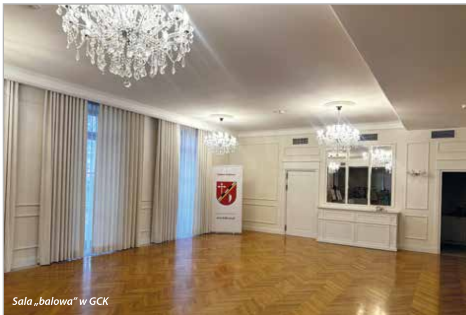
Sala „balowa” w GCK