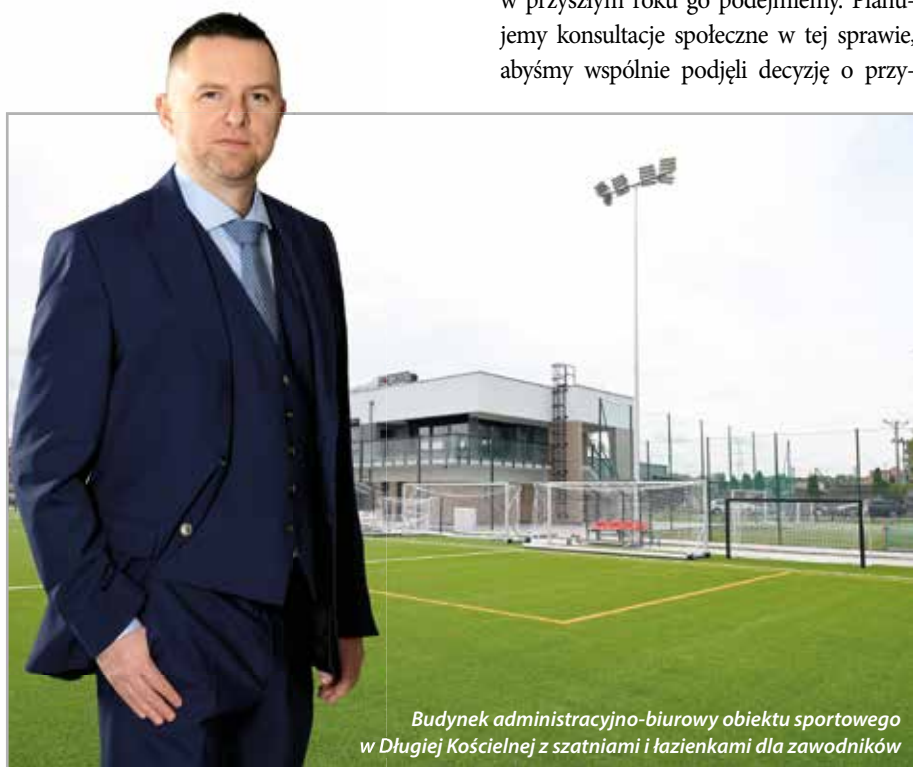
Budynek administracyjno-biurowy obiektu sportowego w Długiej Kościelnej z szatniami i łazienkami dla zawodników