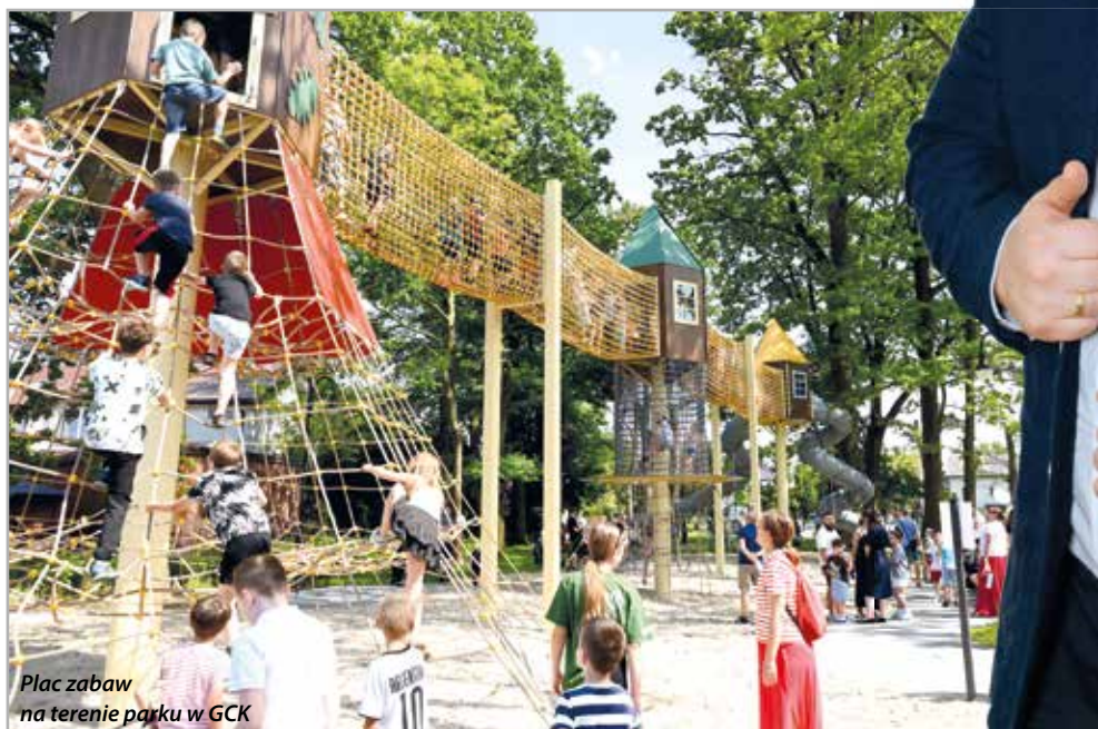
Plac zabaw na terenie parku w GCK

Teren wokół Domu Kultury jest przepiękny i zachęca do spędzania czasu. W okresie letnim będzie czynny w godz. 7.00-22.00. Najmłodsi korzystają z pla-