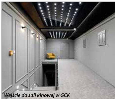
Wejście do sali kinowej w GCK

cu zabaw, młodzież ze skateparku i linearium, a starsi spacerują alejkami i podziwiają fontanny i zielen. Najważniejsze to szanować to miejsce oraz dbać o porządek i czystość, aby służyło i cieszyło przez najbliższe lata.