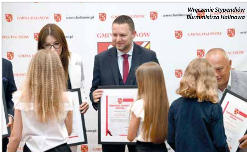
Wręczenie Stypendiów Burmistrza Halinowa

Mamy kilka takich budynków, ale potrzeby są znacznie większe. Jest to dość powszechny problem w gminach. My złożyliśmy wniosek o udzielenie wsparcia finansowego z Funduszu Dopłat w ramach realizacji przez BGK rządowego programu budownictwa komunalnego na budowę trzech budynków komunalnych w Długiej Kościelnej. Ma się tam