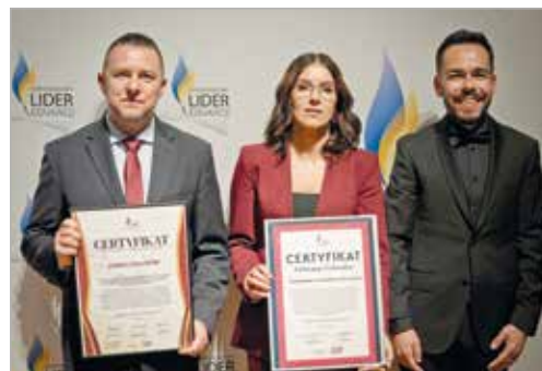
We wrześniu 2025 roku Gmina Halinów została wyróżniona w XIV edycji Konkursu „Samorządowy Lider Edukacji”

Rekreacyjny przy Gminnym Centrum Kultury w Halinowie. To prawie dwa hektary miejsca na odpoczynek i różnego rodzaju aktywności. Jest tu boisko do siatkówki, skatepark, place zabaw dla dzieci, fontanny i dużo trawy, na której można rozłożyć koc i zrobić sobie piknik. 17 października oddaliśmy do użytku dawny dworek majątku Skrudą, który po odrestaurowaniu, służy jako siedziba Gminnego Centrum Kultury. Zbudowaliśmy nową bibliotekę gminną, która również służy mieszkańcom. Oprócz tego rozpoczęliśmy inwestycję w Domu Kultury w Okuniewie. Chcemy, aby po remoncie wróciło do niego kulturalne życie Okuniewa i okolic. Mamy prężnie działające kluby sportowe, KS Halinów