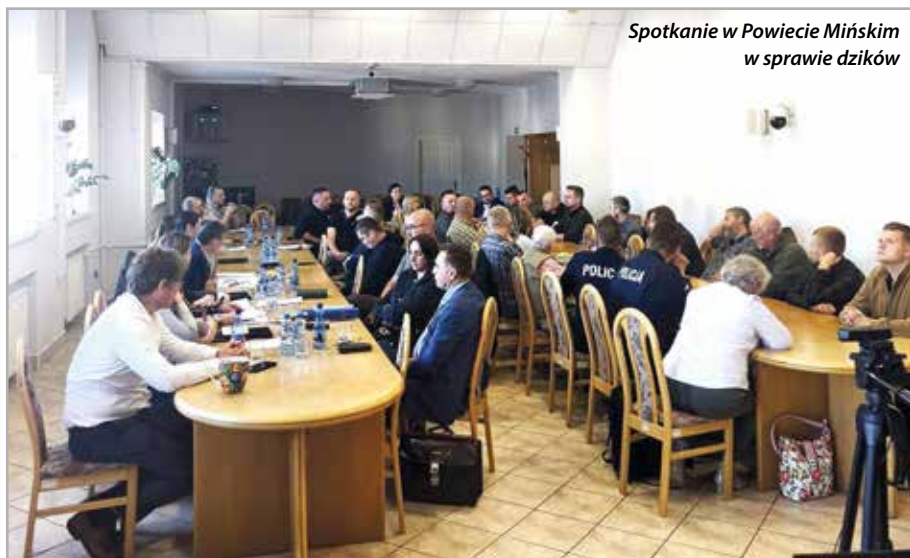
Spotkanie w Powiecie Mińskim w sprawie dzików