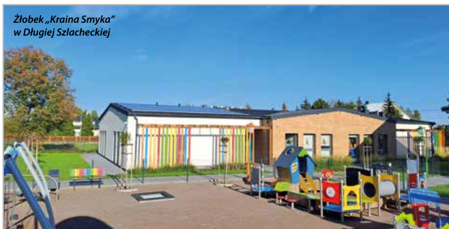
Żłobek „Kraina Smyka” w Długiej Szlacheckiej

programy, które realnie poprawiały jakość życia mieszkańców w całej Polsce. Teraz jest ich mniej. Do tej pory udało nam się pozyskać fundusze z KPO na program „Maluch+” oraz istnieje szansa na sfinansowanie termomodernizacji Zespołu Szkolno-Przedszkolnego w Halinowie. To ważne inwestycje z punktu widzenia mieszkańców, których dzieci uczą się w naszej szkole podstawowej. Odmówiono nam natomiast wsparcia na budowę sieci kanalizacji sanitarnej, która jest bardzo ważna dla naszej społeczności. W obecnych czasach dystrybucja środków zewnętrznych do samorządów została mocno okrojona. Uważam, że fundusze KPO, które tak naprawdę są pożyczką i to my będziemy ją spłacać, powinny być kolportowane w sposób transparentny, nie wzbudzający żadnych kontrowersji, a do tego powinny trafiać do tych, którzy tego wsparcia realnie potrzebują.