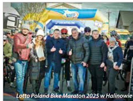
Lotto Poland Bike Maraton 2025 w Halinowie

Nasza gmina aktywnie wspiera udział mieszkańców w programie Czyste Powietrze, który umożliwia otrzymanie dofinansowania m.in. na wymianę starych pieców oraz termomodernizację budynków. Oferujemy doradztwo oraz pomoc przy wypeł-